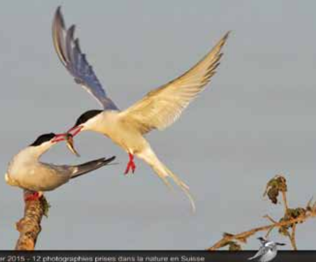
Calendrier 2015 - 12 photographies prises dans la nature en Suisse

Sterne arctique - Pulliste du ciel de nuit ou elle semble poursuivre ses sœurs, la Sterne arctique effectue le tour de la terre chaque année, couvrant au dessus de l'équateur les deux pôles de la planète en fait la chaussonne des migrations arctiques, toutes continents confondus. Comme certains individus vivent plus de 30 ans, les distances parcourues au vol d'oiseau peuvent rivaliser le demi-million de kilomètres ! Le très faible bruit de l'aéropile à l'aveugle le soir n'est pas un détail qui détonne, tant elle ressemble à la Sterne pierregarin, son vois. En fait, elle s'en distingue par ses ailes uniformément pâles alors que son proche confrère arbore par les ailes primaires internes, ainsi que par ses fortissimo d'ailes plus anguleux.