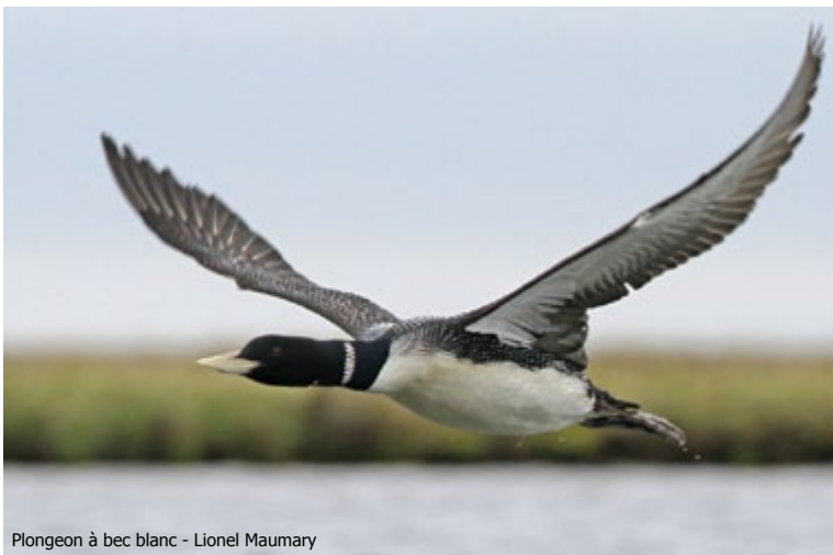
Plongeon à bec blanc - Lionel Maumary