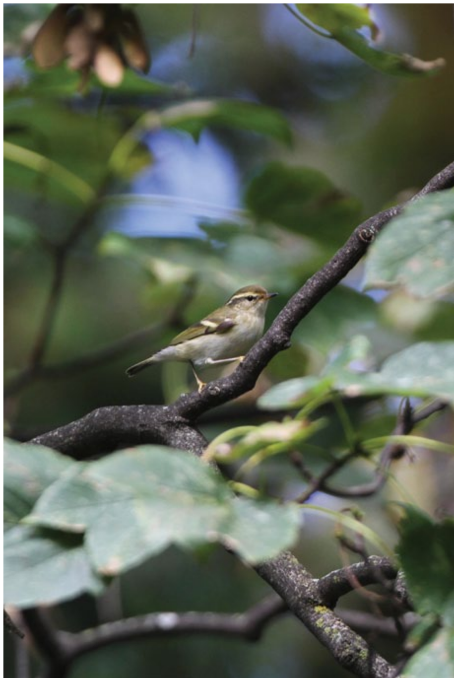
Pouillot à grands sourcils que Lionel Maumary a découvert le 29 octobre 2013 en pleine ville de Lausanne à la Place de Milan