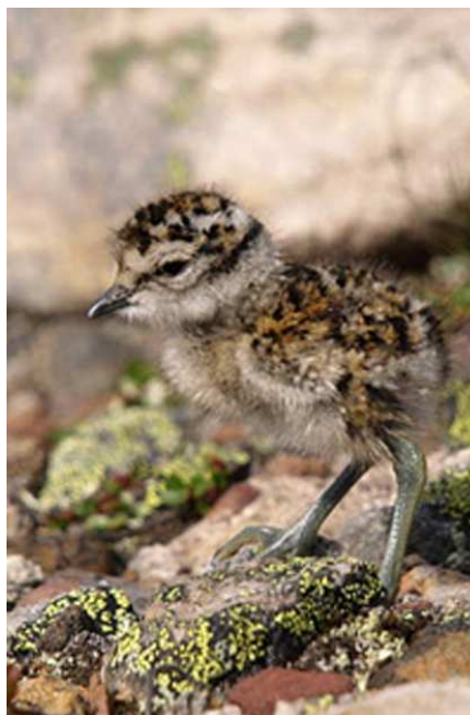
Poussin de Pluvier guignard, Lutz Lucker

Après une virée dans la vallée du Pasvik avec ses pins tricentenaires et Tétrars, nous descendons le long de la frontière Russe en Finlande pour admirer une dizaine d'Ours bruns. – Une partie de la conférence sera consacrée à l'énigmatique biologie de reproduction des Guignards.