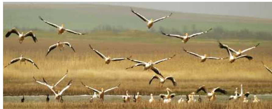
Pélicans blancs à l'envol au delta du Danube