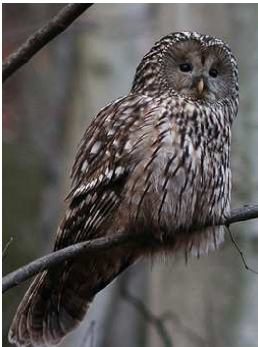
Chouette de l'Oural décembre 2004